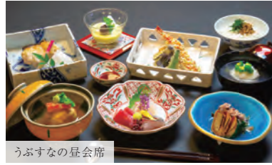
うぶすなの昼会席

新しい門出の食事会、お顔合わせ、ご結納、お宮参り、お食い初めなど華やかなお祝い料理です。