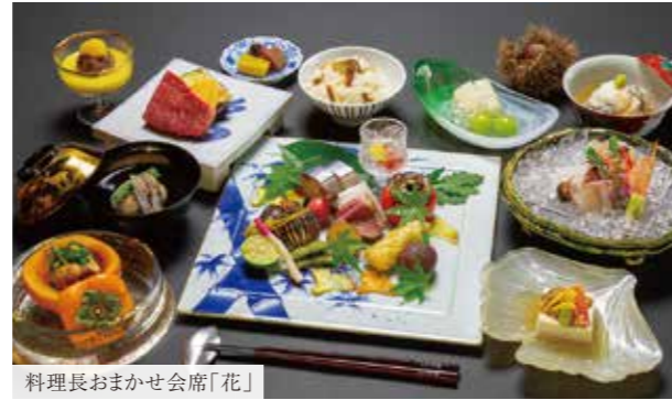
料理長おまかせ会席「花」

※写真はイメージです ※仕入れによってメニューが変更となる場合がございます 詳細はお問い合わせください