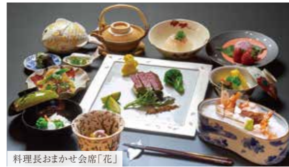
料理長おまかせ会席「花」

※仕入れによってメニューが変更となる場合がございます 詳細はお問い合わせください