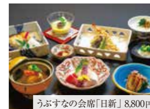
うぶすなの会席「日新」8,800円