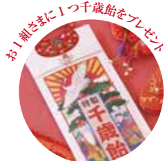
お1組さまに1つ千歳飴をプレゼント