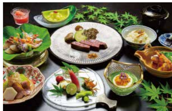
※写真は料理長おまかせ会席「花」のイメージ写真です。仕入れによってメニューが変更となる場合がございます。