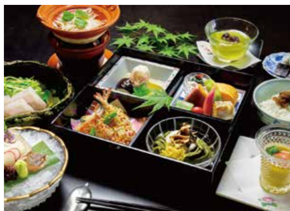
※写真はうぶすなの箱のイメージ写真です。仕入れによってメニューが変更となる場合がございます。

大切な人とのご会食 ～ゆったりと流れる時間と特別なお料理をぜひお楽しみください～